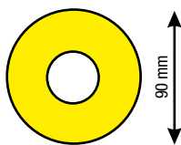
Alt sistem 32/90 Sistem compozit \lambda = \text{valoare } 0,027 \text{ W/mK}