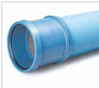
1.1 AWADUKT Thermo Sistemul de conducte

- Strat interior antimicrobian pentru introducerea igienică a aerului proaspăt - Conductă PP cu perete plin, optimizată cu transfer termic îmbunătățit